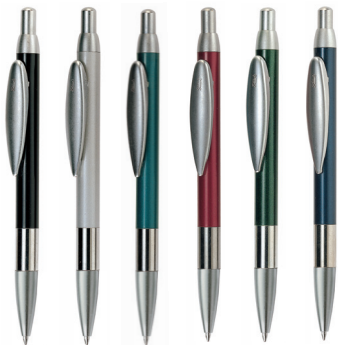
NE GR CO RO VE BL SERIE 450 MC